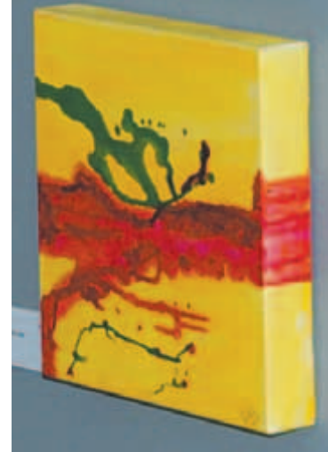
Plus de trente œuvres comme celle-ci ont ainsi été mises à l'encan silencieux afin de soutenir l'Échelon dans son travail de soutien en santé mentale.