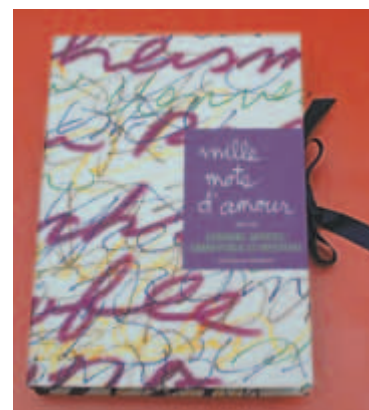
Le coffret intitulé Mille mots d'amour

Un coffret intitulé Mille mots d'amour , écrit par des Impatients, des artistes, des élèves d'une école secondaire sensibilisés aux problèmes de santé mentale, est également en vente afin de permettre l'autofinancement continu de ces belles initiatives thérapeutiques.