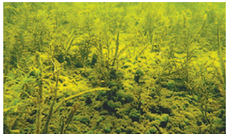
Zone littorale, lac St-Amour, août 2008

pour définir et classer la végétation aquatique et les algues épiphytiques.