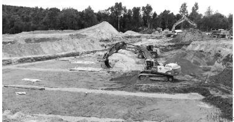
Le chantier de construction du troisième étang aéré de l'usine d'épuration de Prévost.