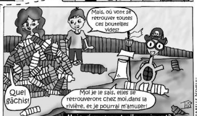
Inspirée du livre «Mal de Terre» d'Hubert Reeves