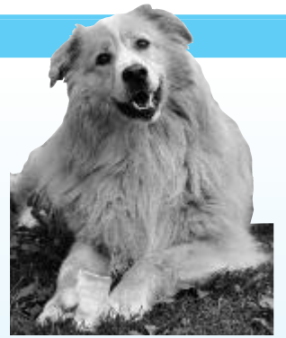
Vous pouvez m'écrire, mon maître se fera un plaisir de me lire vos lettres: apcp_wouf@yahoo.ca www.wouflaurentides.org

Je ne suis pas certain de comprendre tout ce qui m'arrive, mais à le voir s'exclamer devant la page