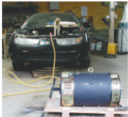
L'inventeur, M. Lanthier prend la route d'une industrie plus verte

Les assurances sont un obstacle important à l'utilisation des voitures converties. Les compagnies d'assurance ne veulent pas les assurer. Un groupe de jeunes a réussi à faire homologuer leurs véhicules transformés parce que ceux-ci n'ont pas